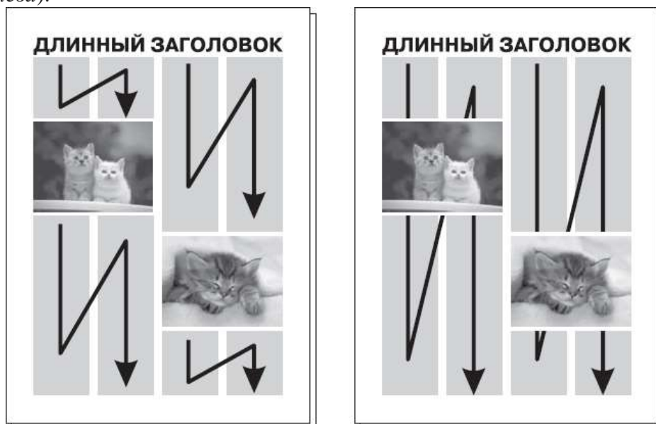
Рис. 3.4. Схема неправильного ( слева ) и правильного ( справа ) продолжения текста при разрыве колонки иллюстрацией или врезкой

Если фотография, иллюстрация или врезка разрывает колонку (а надо сказать, что такое будет случаться постоянно, ведь трудно представить себе фотографию настолько узкую, чтобы она была меньше одной колонки по ширине), то текст должен продолжаться под фотографией (рис. 3.4, справа ). Начинающие дизайнеры иногда верстают колонки так, что, дойдя до фотографии, текст начинается в следующей колонке сверху, а это неверно (рис. 3.4, слева ).